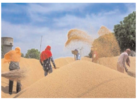
अनुसार की जानी चाहिए। एक अलग बयान में केंद्रीय खाद्य मंत्रालय ने कहा कि 'उसका मानना 27 है कि पंजाब और हरियाणा में तीन अक्टूबर से एमएसपी (न्यूनतम समर्थन मूल्य) पर धान की खरीद शुरू करने का फैसला किसानों और उपभोक्ताओं के समग्र हित में है। राष्ट्रीय खाद्य सुरक्षा कार्यक्रम के

नई दिल्ली। केंद्र ने किसानों के हित में पंजाब और हरियाणा में तीन अक्टूबर से धान खरीद शुरू करने का आदेश जारी किया।