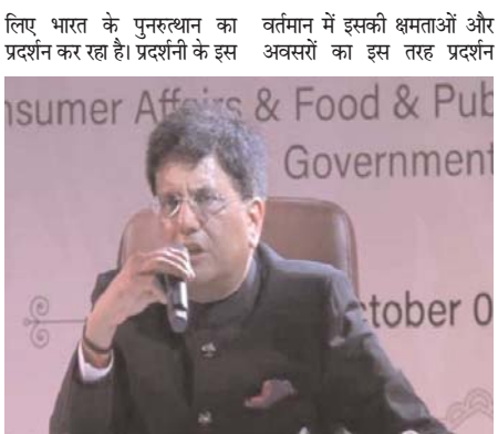
वर्तमान में इसकी क्षमताओं और अवसरों का इस तरह प्रदर्शन लिए भारत के पुनरुत्थान का प्रदर्शन कर रहा है। प्रदर्शनी के इस वर्तमान में इसकी क्षमताओं और अवसरों का इस तरह प्रदर्शन

दुर्बई। वाणिज्य और उद्योग मंत्री पीयूष गायल ने शनिवार को कहा कि उन्हें उम्मीद है कि प्रधानमंत्री नरेंद्र मोदी दुर्बई एक्सपो 2020 में आने का निमंत्रण स्वीकार करेंगे।