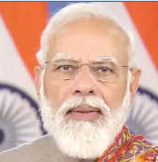
PM, नरेंद्र मोदी

भरपूर प्रयास करने के बावजूद हम कुछ किसानों को इन कृषि कानूनों के बारे में समझा नहीं पाए।