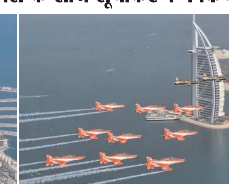
फुर्सन डिस्प्ले टीम के साथ मिलकर फ्लाइंगपास्ट किया। दुबई में यह एयर शो हर 2 साल में आयोजित किया जाता है।