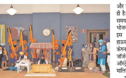
कहा कि गुरु नानक देव जी की शिक्षाओं 'अपनी प्रार्थना करो और अपना भोजन साझा करो ने मुझे बहुत प्रभावित किया है। मैं आप सभी को गुरुद्वारा में खाना बनाते