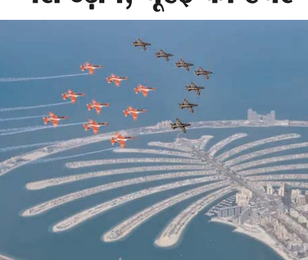
दुबई। पिछले 5 दिनों से दुबई एयरशो के आखिरी दिन भारतीय वायुसेना के तेजस और सूर्यकिरण एयरक्राफ्ट की धूम रही। सूर्यकिरण एरोबेटिक्स टीम ने यूई की अल