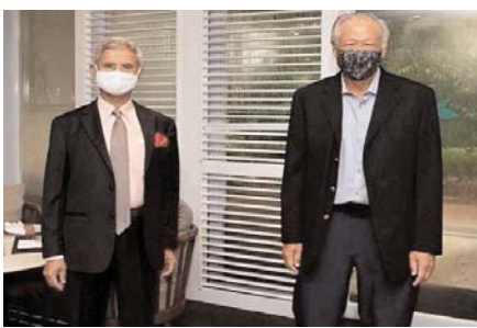
'सिंगापुर के वरिष्ठ मंत्री और सामाजिक नीतियों के समन्वयक मंत्री धरमन षण्मुगुरत्तम से

सिंगापुर। विदेश मंत्री एस जयशंकर ने सिंगापुर के अपने समकक्ष और रक्षा मंत्री समेत वरिष्ठ मंत्रियों से मुलाकात की और भारत एवं सिंगापुर के बीच सामरिक साझेदारी को मजबूत करने के तरीकों पर चर्चा की। जयशंकर तीन दिवसीय यात्रा पर सिंगापुर पहुंचे। उन्होंने सिंगापुर के विदेश मंत्री विवियन बालकृष्णन के साथ 'सार्थक बातचीत' की। जयशंकर ने ट्वीट किया, 'एक महत्वपूर्ण सामरिक साझेदार के साथ सार्थक बातचीत हुई। शाम मेजबानी के लिए