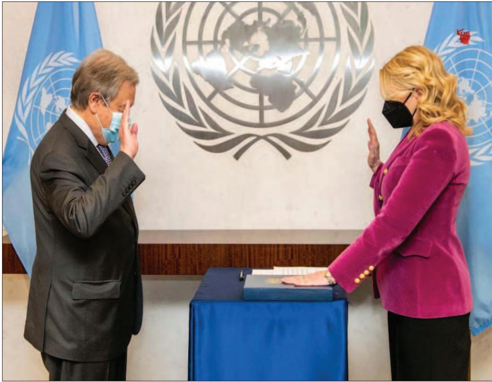
न्यूयॉर्क में संयुक्त राष्ट्र मुख्यालय में संयुक्त राष्ट्र महासचिव एंटोनियो गुटेर्रेस नई कार्यकारी निदेशक कैथरीन रसल के शपथ ग्रहण के दौरान उपस्थित थे।

वाशिंगटन। अमेरिकी नियामकों ने दवा निर्माता कंपनियों फाइजर और बायोएनटेक से छह महीने से पांच साल तक के बच्चों के लिए उनकी कोविड-19 वैक्सिन की दो डोज के आपातकालीन उपयोग के लिए आवेदन करने को कहा है। जबकि तीन डोज वाले टीके पर आंकड़े का इंतजार किया जा रहा है। इस कदम का मकसद जल्द से जल्द फरवरी के अंत तक उनके लिए वैक्सिन का रास्ता साफ करना है। फाइजर और बायोएनटेक ने अपने बयान में कहा यूएस फूड एंड ड्रग इंडमिनट्रेशन (एफडीए) की ओर से किए गए आग्रह के बाद कंपनियों ने 6 महीने से लेकर 5 साल तक के बच्चों के लिए बनी फाइजर-बायोएनटेक कोरोना वैक्सिन के आपात प्रयोग के लिए आवेदन किया गया है। अगर इस वैक्सिन को मंजूरी मिलती है तो यह पांच साल तक के बच्चों को दी जाने वाली दुनिया की पहली वैक्सिन बन जाएगी। फाइजर के चेयरमैन और सीईओ अल्बर्ट बुर्लो ने कहा है कि पांच साल से कम उम्र के बच्चों का जैसे ही अस्पतालों में भर्ती होना बढ़ रहा है, वैसे ही हमारा लक्ष्य भविष्य के कोरोना वैरिएंट को लेकर तैयार रहने और पैरेंट्स को कोरोना वायरस से बच्चों को बचाने के विकल्प मुहैया कराना है।