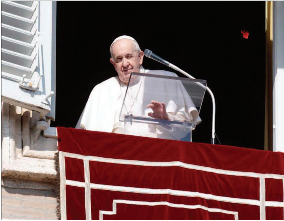
वेटिकन में पोप फ्रांसिस प्रार्थना सभा को संबोधित करते हुए।