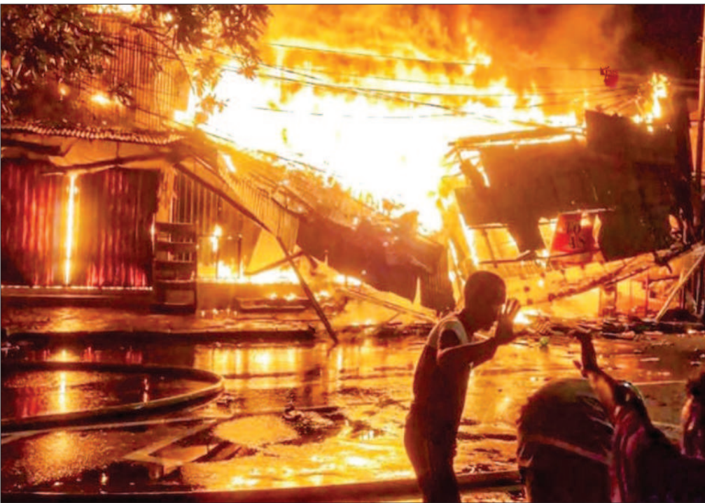
जकार्ता के एक बाजार में लगी आग के बाद मोबाइल से तस्वीरें खींचते हुए एक व्यक्ति।

बर्लिन। विश्व स्वास्थ्य संगठन (डब्ल्यूएचओ) ने कहा है कि यूरोप और अमेरिका में बच्चों को प्रभावित करने वाली युकृत की एक रहस्यमयी बीमारी से एक बच्चे की मौत होने की सूचना मिली है। डब्ल्यूएचओ ने शनिवार को कहा कि उसे अब तक दर्ज-भर देशों से 'अज्ञात स्रोत के एप्यूट हेपटाइटिस' के कम से कम 169 मामलों की जानकारी प्राप्त हुई है। पीड़ितों में एक महीने से लेकर 16 साल तक के बच्चे शामिल हैं और बीमार पड़ने वाले 17 बच्चों को युकृत प्रतिरोषण की जरूरत पड़ी। हालांकि, विश्व स्वास्थ्य संगठन ने यह नहीं बताया कि किस देश में मौत हुई है। इस बीमारी के शुरुआती मामले ब्रिटेन में सामने आए थे जहां 114 बच्चों में इसके लक्षण देखे गए। डब्ल्यूएचओ के एक बयान में कहा गया, 'यह स्पष्ट नहीं है कि हेपटाइटिस के मामले बढ़ रहे हैं या पहले से अधिक मात्रा में हेपटाइटिस के मामले सामने आए हैं जो पहले नहीं आते थे।' विशेषज्ञों का मानना है कि यह मामले टंड से संबंधित वायरस के हो सकते हैं और इसपर अनुसंधान जारी है।