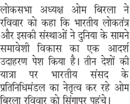
लोकसभा अध्यक्ष ओम बिरला ने रिविवार को कहा कि भारतीय लोकतंत्र और इसकी संस्थाओं ने दुनिया के सामने समावेशी विकास का एक आदर्श उदाहरण पेश किया है।