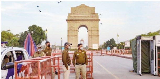
लश्कर-ए-तैयबा और जैश-ए-मोहम्मद सहित कुछ आतंकी संगठन देश में किसी बड़ी वारदात को अंजाम दे सकते हैं

15 अगस्त को लेकर इंटेलिजेंस ब्यूरो ने दिल्ली पुलिस और सीमा सुरक्षा बल (बीएसएफ) को आतंकी हमले का अलर्ट भेजा है। आईबी ने दिल्ली पुलिस और अन्य को 10 पन्नों की रिपोर्ट भेजी है, जिसमें कहा गया है कि लश्कर-ए-तैयबा और जैश-ए-मोहम्मद सहित कुछ आतंकी संगठन देश में किसी बड़ी वारदात को अंजाम दे सकते हैं। बात दें कि देश इस साल आजादी का 75वां अमृत महोत्सव मना रहा है। इस लेकर आईबी ने दिल्ली पुलिस और अन्य एजेंसियों को 15 अगस्त के मौके पर सुरक्षा चाक चौबंद करने को कहा है। 10 पन्नों के अपने अलर्ट में आईबी ने बताया कि पाकिस्तानी खुफिया एजेंसी आईएसआई आतंकीयों को लाइसेंसिड सपोर्ट देकर कोई बड़ी वारदात करने की फिराक में है। इसके लिए दिल्ली पुलिस को लाल किले के सभी प्रवेश द्वार पर सुरक्षा कड़ी करने की हिदायत दी गई है। सीमा सुरक्षा बल यानी बीएसएफ को भी बॉर्डर इलाके में चौकसा रहने को कहा गया है। सूत्रों के मुताबिक, आईबी ने अपनी रिपोर्ट में