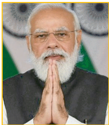
पद्मश्री हलधर नाग भी प्रधानमंत्री के इस भोज में शामिल हुए थे। उनके पास वर्तमान में तीन जोड़ी कपड़े, एक टूटी रबड़ की चप्पल, एक बिन कमानी का चश्मा और जमा पूंजी सात से बीस रुपयें हैं। पद्मश्री सम्मान की सूचना मिली तो उन्होंने जवाब भेजा कि साहब नई दिल्ली आने के पैसे नहीं हैं। कृपया पुरस्कार डाक से भिजवा दें। कहने में गुरेज नहीं कि मोदी सरकार ऐसे लोगों के द्वार तक पहुंच रही है। सम्मान दे रही है। यह संकल्प सिद्धि का नया भारत है। इन नये भारत के नायक प्रधानमंत्री नरेन्द्र मोदी हैं। (लेखक, स्वतंत्र टिप्पणीकार हैं।)