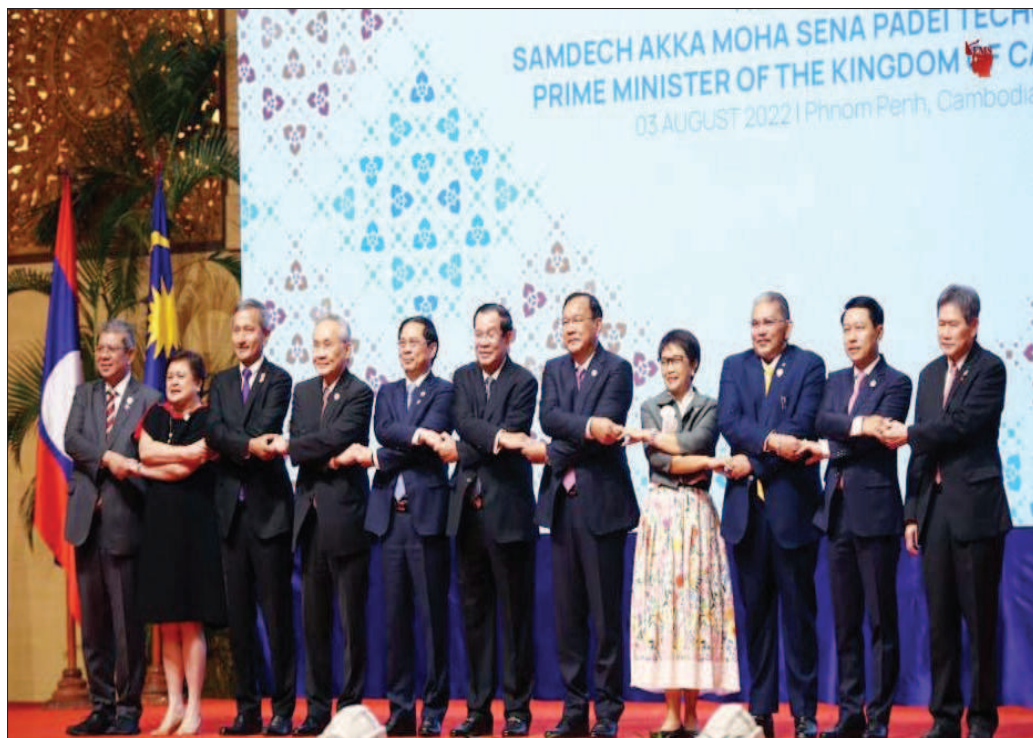
नोमपेह में आसियान देशों के विदेश मंत्री एकसाथ नजर आये।

बारसिलोना। स्पेन में इन दिनों महिलाओं पर नुकीली सुई से हमले की घटनाएं बढ़ गई हैं। इसको लेकर महिलाओं में दहशत पैदा हो गई है। ऐसे हमले ज्यादातर भीड़-भाड़ वाली जगहों पर होते हैं। ब्रिटेन और फ्रांस में भी इसी तरह की घटनाएं हुई हैं। स्पेन की पुलिस भीड़-भाड़ वाले स्थानों पर सिरिज से जुड़े हमलों की जांच कर रही है। पिछले कुछ हफ्तों में इस तरह की घटनाओं पुलिस में को रिपोर्ट किया गया है। वहीं सोशल मीडिया पर भी कई लोग इस हमले के बारे में लिख रहे हैं। रिपोर्ट किए गए मामलों में आशंका जताई जा रही है कि हमलावर महिलाओं पर यौन हमला करने के लिए सिरिज में नशीला पदार्थ मिला कर हमला कर रहा है। हालांकि, अब तक दवाओं या अन्य जहरीले उत्पादों के कोई निशान नहीं मिले हैं। इसके साथ ही सुई हमले के बाद किसी तरह की यौन हिंसा का मामला भी सामने नहीं आया है। पिछले कुछ हफ्तों में पुलिस ने केटालोनिया में 23 ऐसे मामले दर्ज किए हैं। ये मामले ज्यादातर पर्यटक शहर लोरेट डी मार और बार्सिलोना में और 12 बारक में दर्ज किए गए हैं। बारक पुलिस के मुताबिक हमलावर ज्यादातर युवा महिलाओं को टारगेट करते हैं। हमले का पैटर्न लगभग एक समान है। आमतौर पर एक युवा महिला जब पार्टी से बाहर जा रही होती है, तब उस पर यह हमला होता है। हमले में सुई हाथ या पैर में चुभती है और इसके प्रभाव से महिला को सिर में चक्कर आते हैं या फिर नींद आ जाती है।