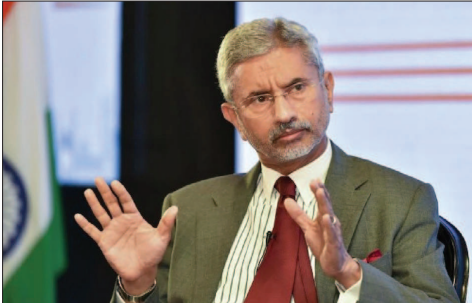
नई दिल्ली ।

भारत के विदेश मंत्री एस जयशंकर ने पड़ोसी मुल्क पाकिस्तान की आतंकवाद को शाह देने की करतूतों पर खिंचाई की और कहा कि कोई अन्य देश 'आतंकवाद की प्रैक्टिस' नहीं करता है। उन्होंने कहा कि मोदी सरकार की कूटनीति ने अन्य देशों को आतंकवाद के मुद्दे को गंभीरता से लेने के लिए प्रेरित किया।