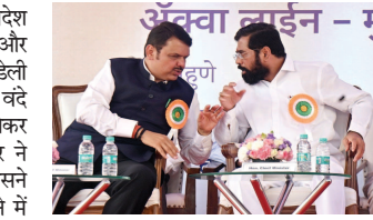
अंधेरा लाइन - मुंबई। कुल मिलाकर देखें तो जब से महाराष्ट्र में एकनाथ शिंदे और देवेंद्र फडणवीस के नेतृत्व वाली सरकार बनी है तब से लगातार कई बड़े निर्णय लिए जा रहे हैं। महाराष्ट्र सरकार का यह आदेश अधिकारियों के लिए सभी मोबाइल फोनों और लैपटॉप फोनों पर लागू होगा। अपने डेली रूटीन में भी अधिकारी एक-दूसरे को वंदे मातरम से ही संबोधित करेंगे। इसको लेकर महाराष्ट्र सरकार में मंत्री दीपक केसरकर ने कहा कि वंदे माता में एक ऐसा मंत्र है जिसने अंग्रेजों के खिलाफ देश को स्वतंत्र कराने में बड़ी भूमिका निभाई है। पूरे भारतवर्ष

मुंबई। महाराष्ट्र सरकार का यह आदेश अधिकारियों के लिए सभी मोबाइल फोनों और लैपटॉप फोनों पर लागू होगा। अपने डेली रूटीन में भी अधिकारी एक-दूसरे को वंदे मातरम से ही संबोधित करेंगे। इसको लेकर महाराष्ट्र सरकार में मंत्री दीपक केसरकर ने कहा कि वंदे माता में एक ऐसा मंत्र है जिसने अंग्रेजों के खिलाफ देश को स्वतंत्र कराने में बड़ी भूमिका निभाई है। महाराष्ट्र के शिंदे फडणवीस सरकार ने बड़ा आदेश जारी किया है। नए आदेश के मुताबिक अब सरकारी अधिकारी हेलो की जगह वंदे मातरम बोल कर अभिवादन करेंगे। यानी कि जब भी आप महाराष्ट्र सरकार के अधिकारियों को फोन करेंगे तो वह हेलो की जगह आपको वंदेमातरम कहते सुनाई देंगे। इसके लिए सरकारी आदेश भी जारी कर दिया गया है। इससे पहले महाराष्ट्र के सांस्कृतिक मंत्री सुशील मुनगाटीवार ने सरकारी अधिकारियों को फोन काल पर हेलो की जगह वंदे मातरम बोलने का आदेश दिया