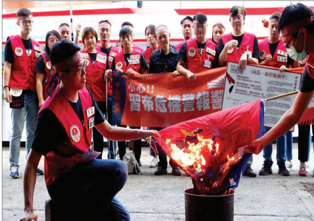
ताइवान में चीन के झड़े को आग के हवाले करते हुए एक पार्टी के कार्यकर्ता।