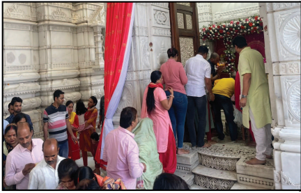
सूरत भूमि, सूरत।

श्री श्याम सेवा ट्रस्ट द्वारा महाशिवरात्रि उत्सव का आयोजन शनिवार को वीआईपी रोड, वेसु स्थित श्री श्याम मंदिर प्रांगण में किया गया। इस अवसर पर भगवन भोले का आलौकिक श्रृंगार किया गया। महाशिवरात्रि के उपलक्ष्य में मंदिर प्रांगण में विशाल भजन संध्या का