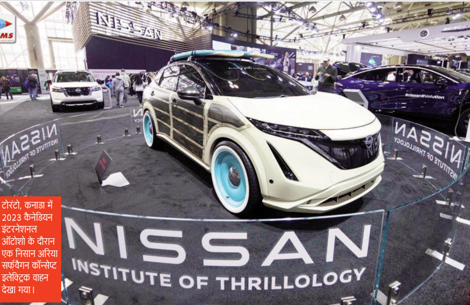
टोरंटो, कनाडा में 2023 कैनेडियन इंटरनेशनल ऑटोशो के दौरान एक निसान आरिया साईबेगन कॉन्सेप्ट इलेक्ट्रिक वाहन देखा गया।

खुला और 158 अंक की तेजी के साथ 17929 पर बंद हुआ। बुधवार को सेंसेक्स 258 अंक टूटकर 60,774 पर खुला और 242.83 अंक चढ़कर 61275.09 पर बंद हुआ। निफ्टी 68 अंक गिरकर 17,862 पर खुला और 86 अंक चढ़कर 18015.85 पर बंद हुआ। गुरुवार को सेंसेक्स 396 अंक चढ़कर 61,671 पर खुला और 44.42 अंक चढ़कर 61,319.51 पर बंद हुआ। निफ्टी 110 अंक चढ़कर 18,126 पर खुला और 20 अंक चढ़कर 18035.85 पर बंद हुआ। शुक्रवार को सेंसेक्स 326 अंक टूटकर 60,994 पर खुला और 316.94 अंक (0.52 प्रतिशत) गिरावट के साथ 61,002.57 पर बंद हुआ। निफ्टी 61 अंकों के नुकसान के साथ 17,975 पर खुला और 91.65 अंक (0.51 प्रतिशत) की गिरावट के साथ 17,944.20 पर बंद हुआ।