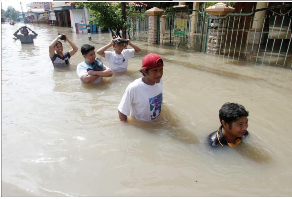
हेग में 60 से अधिक देशों के प्रतिनिधि ऑस्ट्रेलियाई इटेलीजेंस को लेकर एक सम्मेलन में शामिल हुए।

वाशिंगटन। संयुक्त राष्ट्र में भारत की स्थाई प्रतिनिधि रुचिरा कंबोज को संयुक्त राष्ट्र के सामाजिक विकास आयोग के 62वें सत्र का अध्यक्ष चुना गया। कंबोज को इस सप्ताह न्यूयॉर्क में संयुक्त राष्ट्र मुख्यालय में संयुक्त राष्ट्र सामाजिक विकास आयोग के 62वें सत्र की पहली बैठक में अध्यक्ष चुना गया है। इसके साथ ही नॉर्थ मैसोडोनिया से जॉन इवानोवस्की, डोमिनिक गणराज्य से कार्लो मारिया कार्लसन और लक्समबर्ग से थॉमस लैमर को 62वें सत्र का उपाध्यक्ष चुना गया।