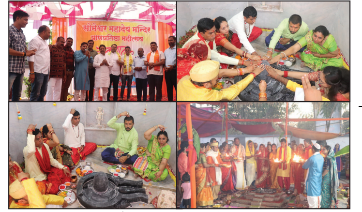
सूरत भूमि, सूरत। महाशिवरात्रि के शुभ अवसर पर शनिवार को डिंडोली करडवा रोड स्थित साई विला रेसोडेंसी में श्री सोमेश्वर महादेव मंदिर के प्राण प्रतिष्ठा महोत्सव का आयोजन किया गया और मंदिर निर्माण में भाग लेने वाले मंदिर निर्माताओं और मंदिर को दान देने वाले दानदाताओं को सम्मानित भी किया गया। गांव में रहने वाले समाज के नन्हें-मुत्ते बच्चों ने मनमोहक नृत्य व विभिन्न नृत्यों का कार्यक्रम प्रस्तुत किया।