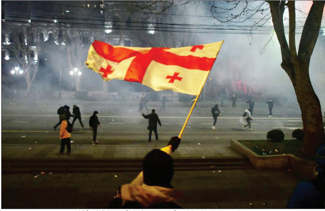
जोर्जिया में विरोध प्रदर्शन के दौरान एक प्रदर्शनकारी देश के झंडे को लहराते हुए।

घटनास्थल से आई फुटेज में नजर आ रहा है कि कई दर्जन हथियारबंद पुलिस ऑफिसर्स सेंटर के अंदर मौजूद हैं, जबकि एक हेलीकॉप्टर ऊपर चक्कर लगा रहा है। चर्च के आसपास की सभी गलियों की नाकेबंदी कर दी गई है। पुलिस ने इस इलाके में सर्वोच्च स्तर के खतरे की चेतावनी दी है। आसपास के लोगों को घरों के अंदर ही रहने के लिए कहा गया है। हाल के कुछ वर्षों में जर्मनी में कई ऐसे हमले हुए हैं, जिन्हें कट्टरपंथियों की तरफ से अंजाम दिया गया है।