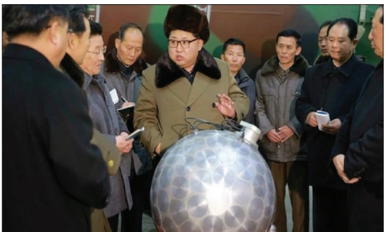
ही अमेरिकी रिपोर्ट में कहा गया है कि नॉर्थ कोरिया अपने परमाणु कार्यक्रमों के लिए क्रिप्टो करेंसी की चोरी करता है।

'शौच एवं अत्यंत उग्र कदम' उठाने के लिए तैयार है। क्रिप्टो करेंसी की चोरी गौरतलब है कि 2006 के बाद नॉर्थ कोरिया ने छह बार परमाणु परीक्षण किया है। हर परीक्षण के बाद उसकी न्यूक्लियर ताकत में इजाफा होता जा रहा है। आपकों बता दें कि किम जोंग उन ने अखिरी परमाणु परीक्षण 2017 में किया था। उसके बाद कई खबरों में आया कि नॉर्थ कोरिया ने एक बार फिर परमाणु परीक्षण कर डाला। हालांकि इसके कोई पुष्टा सबूत नहीं मिले। अमेरिकी रिपोर्ट में दावा किया गया है कि नॉर्थ कोरिया अपने घोषित सैन्य लक्ष्यों को चेतावनी दी थी कि उनका देश डिवाइस का टेस्ट करने जा रहा है। इसके साथ