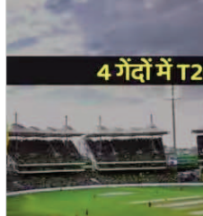
4 गेंदों में T20I मैच खत्म

फिलीपींस क्रिकेट टीम आती है, जो अपनी पारी में 9 रनों पर ही आउट हो गयी थी। दूसरी ओर, थाइलैंड ने एक अनोखे वर्ल्ड रिकॉर्ड की बराबरी की। उसने मैच सिर्फ 4 गेंदों में ही जीत लिया।