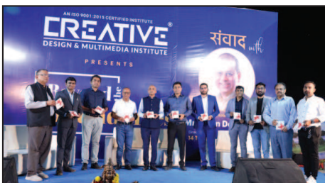
सूरत भूमि, सूरत।

सूरत को IT hub बनाने और IT उद्यमियों को आगे ले जाने के लिए "Beyond the Boundaries" कार्यक्रम आयोजित किया गया था, जहां कार्यक्रम के दौरान 1200 से अधिक IT उद्यमी मौजूद थे। टेक्सटाइल और डायमंड सेक्टर के साथ सूरत शहर को आईटी सेक्टर में आगे ले जाने के लिए Chetan