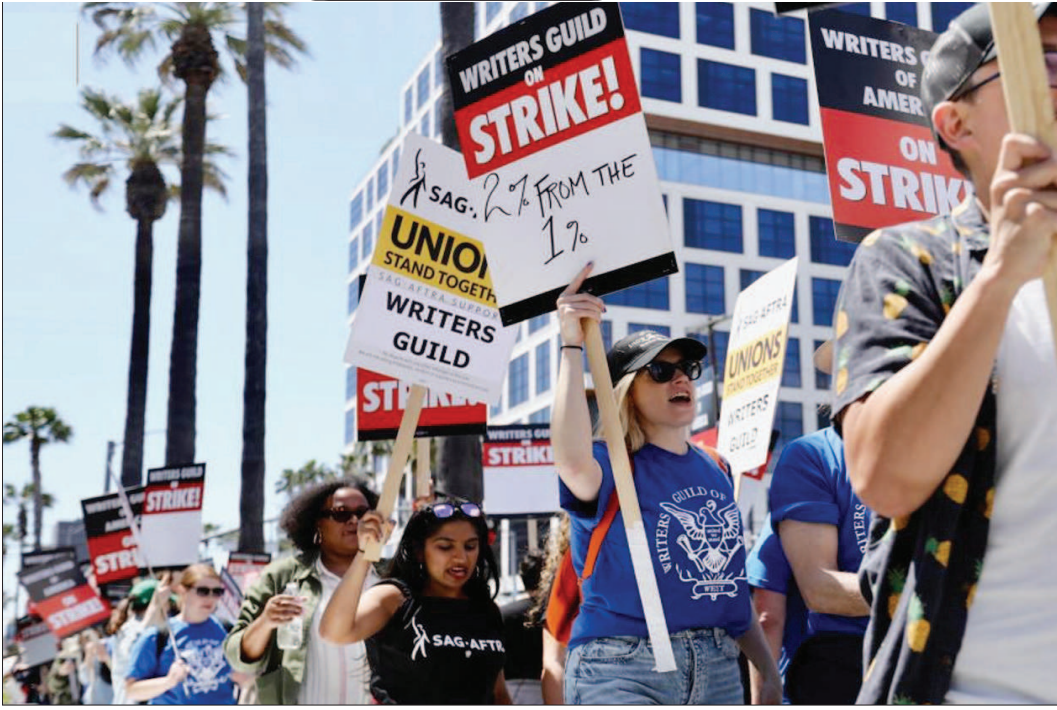
लॉस एंजिल्स में मनोरंजन जगत के लेखक हड़ताल के साथ ही विरोध प्रदर्शन करते हुए।