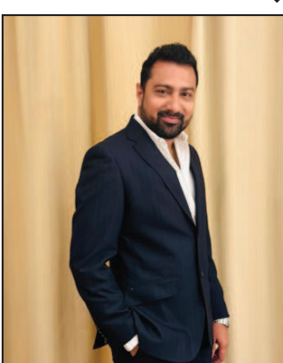
शीश इंडस्ट्रीज लिमिटेड (बीएसई कोड: 540963)

एक भारत-आधारित बहु-अनुशासनात्मक निगम है, जो औद्योगिक और निर्यात