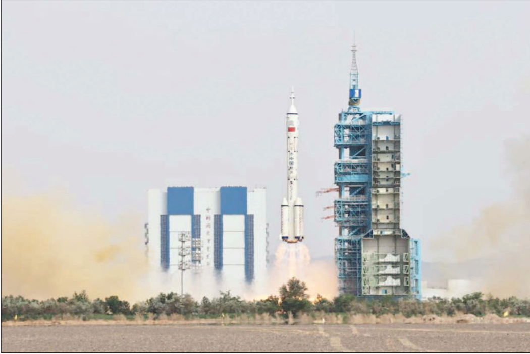
चीन में सेटेलाइट लांच सेंटर से शेंझो लांग मार्च टूथ रॉकेट लांचर दागा गया।

पुलिस ने बताया कि प्राथमिक जांच में पता चला है कि 2 समूहों के बीच झगड़े के कारण गोलीबारी हुई। उसने बताया कि एक व्यक्ति को हिरासत में ले लिया गया है और एक अन्य संदिग्ध की तलाश की जा रही है। गोलीबारी की घटना करीब शाम साढ़े बजे हुई।