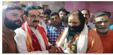
से अत्यात्म पर चर्चा की। गृहमंत्री श्री मिश्रा ने पत्रकारों से बातचीत में कहा कि विधानसभा चुनाव में भाजपा 200 से ज्यादा सीट जीतेगी। उन्होंने कहा कि मध्य प्रदेश में भाजपा के पक्ष में माहौल बना हुआ है। भाजपा पिछले 20 वर्ष से सत्ता में है। इस बार भी परिवर्तन की कोई गुंजाइश नहीं है।