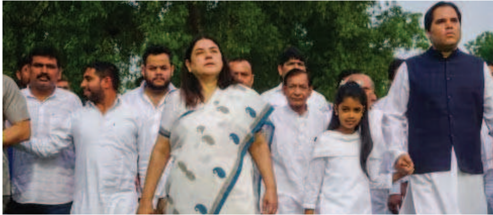
उनकी मां मेनका गांधी भी 2019 में दोबारा बने मोदी सरकार में किसी पद पर नहीं हैं। इससे पहले 2014-19 के दौरान वह महिला एवं बाल विकास मंत्री थीं, लेकिन अब वह भी बेटे की तरह ही महज सांसद हैं और भाजपा के किसी बड़े आयोजन में मंच पर भी नहीं

वरुण गांधी ने कई बार भाजपा नेतृत्व से असहमति जताई है, लेकिन पार्टी ने उन्हें लेकर आधिकारिक तौर पर कुछ नहीं कहा। हालांकि उन्हें कई राज्यों में हुए चुनाव प्रचार में अहमियत नहीं दी गई। यूपी में भी उन्हें कोई अहम भूमिका नहीं सौंपी गई है। इससे साफ है कि नेतृत्व वरुण गांधी को नजरअंदाज कर रहा है। यही नहीं