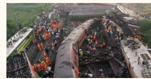
2 जून को हुई घटना को रोका जा सकता था। रिपोर्ट में कहा गया है कि सिग्नलिंग सर्किट अल्टरेशन के काम में पहले हुई खामियों के चलते कोरोमंडल एक्सप्रेस का एक्सीडेंट हुआ था। खास बात है कि रिपोर्ट में दर्ज जानकारीयां सीबीआई की जांच में शामिल

दौरान गलत वायरिंग के चलते ट्रेन अलग ही रास्ते पर चली गई थी। रिपोर्ट में कहा गया है कि लोकल सिग्नलिंग सिस्टम में बार-बार आ रही परेशानियों पर ध्यान दिया जाता, तो