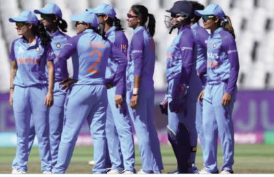
टी20 अंतरराष्ट्रीय और इतने ही एकदिवसीय मैचों की श्रृंखला खेलेंगी।