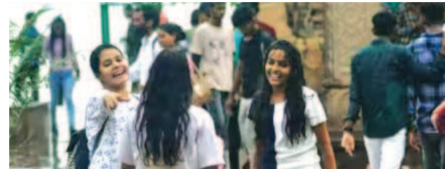
मॉनसून की ट्रफ लाइन फिलहाल पूर्वी उत्तर प्रदेश में सक्रिय है। इससे हवा का कम दबाव वाला क्षेत्र बन रहा है, जिसकी वजह से दो दिनों तक भारी बारिश के लिए चैतावनी जारी की गई है। यूपी के इन जिलों में होगी झमाझम

दिल्ली-एनसीआर में अच्छी बारिश हो सकती है, जिससे तापमान में भी गिरावट आएगी। गोवा का है प्लान? मौसम का भी रखें ध्यान; 5 दिन होगी मुसलाधार बारिश इसके अलावा यूपी में भी अगले कुछ दिन राहत भरे हो सकते हैं। मंगलवार सुबह ही लखनऊ समेत कई जिलों में हल्की बारिश हुई है। यही नहीं गुरुवार तक पूर्वी यूपी के कई जिलों में भारी बारिश की संभावना है। इसके अलावा पश्चिम यूपी और बुंदेलखंड में भी हल्की बारिश हो सकती है। हालांकि ज्यादातर जगहों पर छिटपुट बारिश के साथ गर्मी का ही मौसम बना रहेगा। मौसम विभाग के मुताबिक