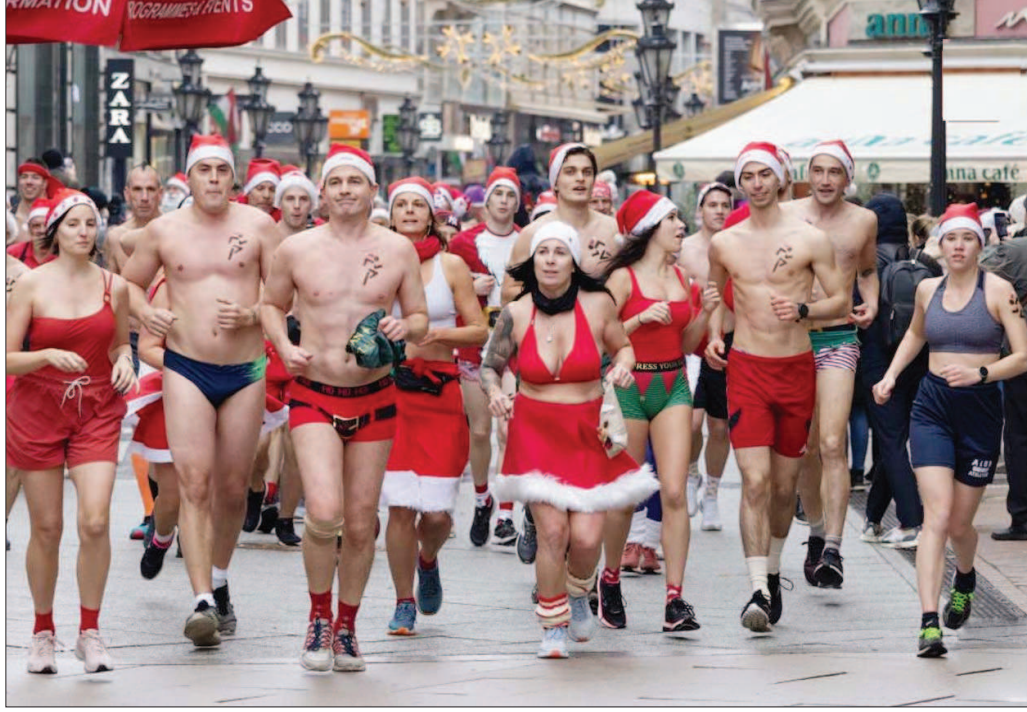
बुडापेस्ट, हंगरी में क्रिसमस मनाने और चेरिटी का समर्थन करने के लिए लोग 20वीं सांता स्पीडो रन में भाग लेते हुए।

कोलंबो। श्रीलंकाई नौसेना ने 25 भारतीय मछुआरों को हिरासत में ले लिया और उनकी दो नौकाओं को जब्त कर लिया। श्रीलंकाई नौसेना ने कहा कि शनिवार रात हिरासत में लिए गए मछुआरे गिरफ्तार नौकाओं में मछली पकड़ रहे थे। मछुआरे तमिलनाडु के नापट्टिनम और पुदुचेरी के कराडकाल जिले के निवासी हैं। पकड़े गए मछुआरों को कंकासातुरे बंदरगाह ले जाकर आगे की कानूनी कार्रवाई के लिए मैलादी मत्स्यतान (निरिधिका) को चोटी दिया गया।