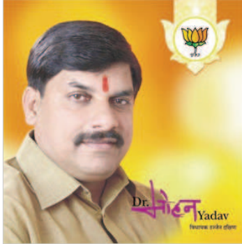
पर्यवेक्षकों की मौजूदगी में विधायक दल ने लगाई सहमति की मोहर