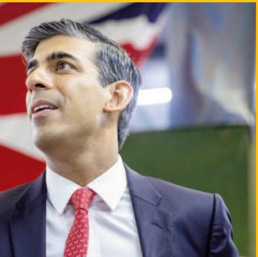
साथ सक्रिय हो गए हैं। इस बात का भी हमें ध्यान रखना होगा।

अब अपनी कुर्सी बचाए रखने के लिए संघर्ष कर रहे हैं। कनाडा ब्रिटेन और अमेरिका के साथ वर्तमान में पृथक खालिस्तान को लेकर जो रिश्ते भारत ने बना रखे हैं। कनाडा और अमेरिका में हत्या करने का आरोप भी भारत सरकार पर लग रहा है। इसका असर भी ब्रिटेन की राजनीति में स्पष्ट रूप से देखने को मिल रहा है। अब इसकी क्रिया और प्रतिक्रिया कैसी होगी, इसके लिए हमें समय का इंतजार करना पड़ेगा। भारत सरकार को भी रिश्तों को लेकर ज्यादा सजग रहने की जरूरत है। अमेरिका कनाडा और ब्रिटेन में जिस तरीके के प्रदर्शन भारतीय समुदाय ने किए हैं। उससे वहां के कट्टरपंथी तेजी के साथ सक्रिय हो गए हैं। इस बात का भी हमें ध्यान रखना होगा।