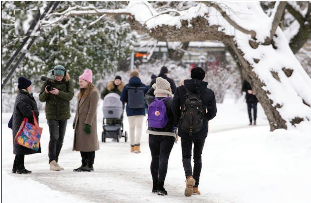
लाटीविया में भारी बर्फबारी के कारण चारों ओर बर्फ ही नजर आयी। ऐसी ही एक बर्फ से ढकी सड़क पर निकलते हुए लोग।

टोक्यो। सुनामी प्रभावित फुकुशिमा-दाइची परमाणु ऊर्जा संयंत्र में एक शोधन मशीन से रेडियोधर्मी पानी का रिसाव हो गया। हालांकि, इसके चलते कोई घायल नहीं हुआ। संयंत्र के अधिकारियों ने इसकी जानकारी दी। उन्होंने बताया कि विकिरण की निगरानी से पता चला कि रिसाव का बाहरी वातावरण पर कोई प्रभाव नहीं पड़ा है। संयंत्र का संचालन करने वाली 'तोकोयो इलेक्ट्रिक पावर कंपनी होल्डिंग्स ने बताया कि दूषित पानी से मुख्य रूप से सीमेंट और स्ट्रॉथियम को हटाने के लिए डिजाइन की गई शोधन मशीन 'सेरी' में वाल्व की जांच के दौरान सुबह एक कर्मचारी को इस रिसाव का पता चला।