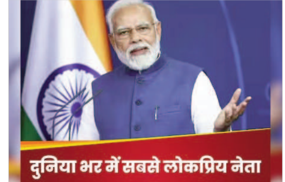
दुनिया भर में सबसे लोकप्रिय नेता

मामलों के विभाग के प्रमुख एलेन बसेट को 57 फीसद, पोलैंड के प्रधानमंत्री डोनाल्ड टस्क के हिस्से में 50 फीसद लोकप्रियता आई है। जबकि ब्राजील के प्रधानमंत्री लुइज़ इंसियो लुला दा सिल्वा के हिस्से में 47 फीसद लोकप्रियता आई है। ऑस्ट्रेलिया के पीएम एंथनी अल्बानीज इसके बाद सूची में 45 फीसद लोकप्रियता के साथ काबिज हैं। वहीं इटली की पीएम जिओर्जिया मेलोनी ने वैश्विक मंच पर 44 फीसद की लोकप्रियता हासिल की है। इसके बाद स्पेन के पीएम पेद्रो सांचेज का नंबर है, जिनको 38 फीसद और यूएस के राष्ट्रपति जो बाइडेन को सूची में 37 फीसद लोकप्रियता बताया गया है। कनाडा के प्रधानमंत्री जस्टिन ट्रूडो को लेकर सूची में 35 फीसद लोकप्रियता का आंकड़ा दिख रहा है। जबकि स्वीडन के प्रधानमंत्री