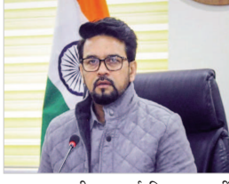
एमएसपी पर खर्च किए गए, वहीं मोदी सरकार ने किसानों को 18 लाख 39 हजार रुपए आवंटित किए हैं जो बड़ी राशि है।

खरीदना पड़े। सरकार की ओर से किसानों को इस दिशा में 3 लाख रुपए सब्सिडी भी दी गई। उन्होंने कहा कि केंद्र सरकार ने किसानों को सहायता प्रदान करने के लिए तीन सालों तक लगातार काम किया और उन्हें नौ नौ यूरिया भी उपलब्ध कराया। जबकि यूपीए सरकार के 10 सालों के शासनकाल में 5.50 लाख रुपए