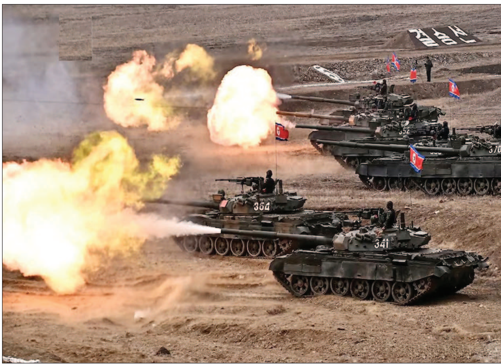
उत्तर कोरियाई सेना अपने शीर्ष नेता किम जोंग उन को टैंक व अन्य हथियारों की मारक क्षमता दिखाती हुई।