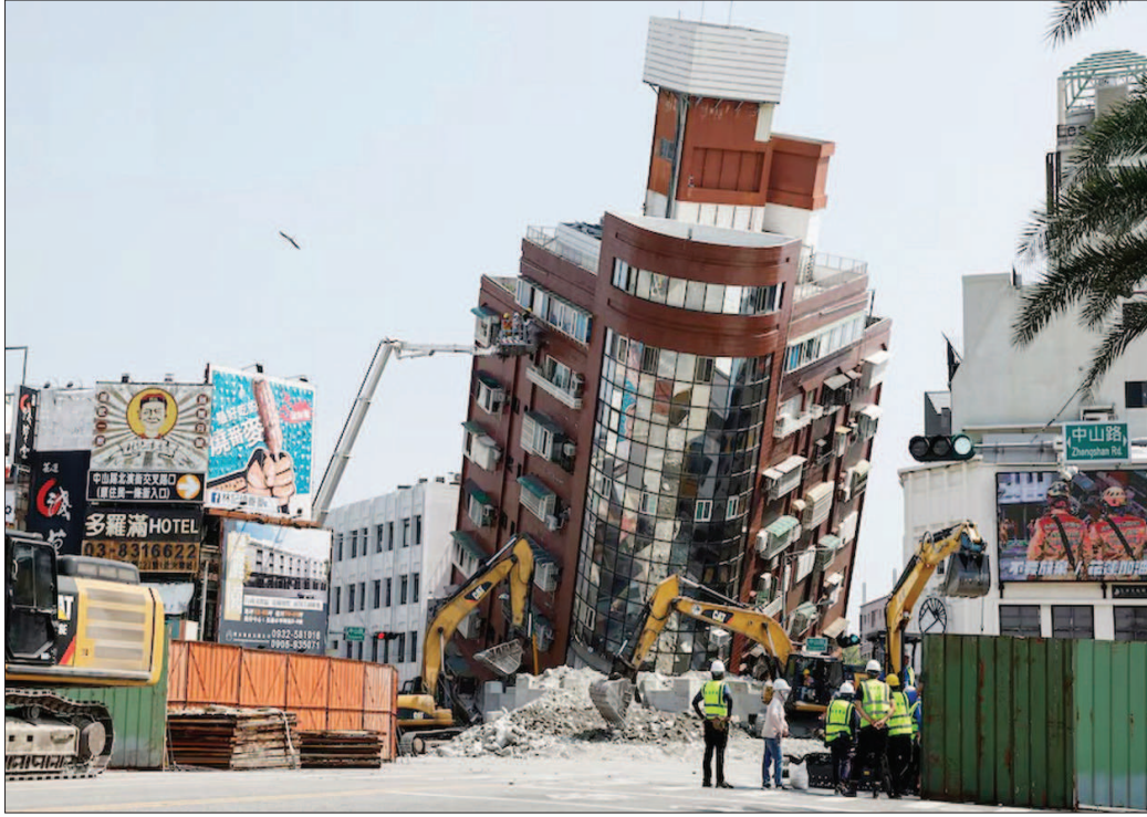
ताइवान में एक ध्वस्त इमारत के पास काम करते हुए कर्मचारी।

यरुशलम। इजरायली सेना ने घोषणा की है कि वह ईरान के साथ बढ़ते तनाव के बीच रिजर्व सैनिकों के साथ अपनी हवाई रक्षा प्रणाली को मजबूत कर रही है। इजरायली सेना ने कहा, आईडीएफ (इजराइल डिफेंस फोर्सज) के हवाई रक्षा तंत्र में जनशक्ति बढ़ाने और रिजर्व सैनिकों को तैनात करने का निर्णय लिया गया है। ईरान ने सीरिया में ईरानी दूतावास पर इजरायली हवाई हमले के खिलाफ जवाबी कार्रवाई की कसम खाई थी। रिपोर्ट के अनुसार, हमले में सीरिया में इस्लामिक रिवायूशनरी गार्ड कौर्स के अनुभवी कमांडर मोहम्मद राजा जाहेदी और उनके ड्रिटी सहित सात ईरानी मारे गए थे। इस हमले के बाद मध्य पूर्व में तनाव और बढ़ गया। इजरायल ने हमले की जिम्मेदारी नहीं ली है।