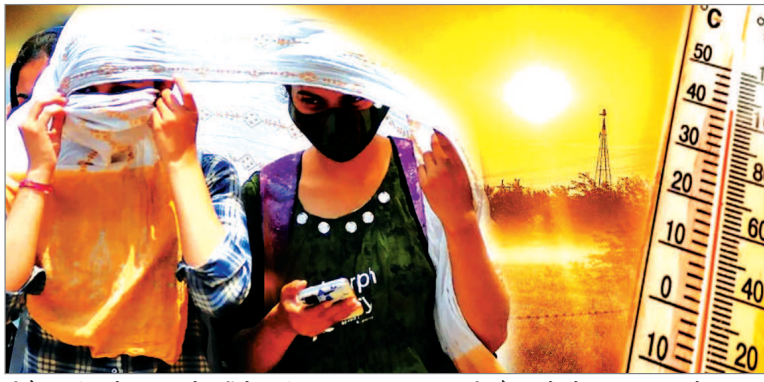
की है। मंडाविया ने बुधवार को गर्मी से संबंधित बीमारियों के मैनजमेंट के लिए सार्वजनिक स्वास्थ्य तैयारियों की समीक्षा करने के लिए एक बैठक की अध्यक्षता की और राज्यों को आवश्यक दवाओं, आइस-पैक, ओआरएस, पीने के पानी के साथ-साथ जनता के लिए आईसीसी एक्टिविटी को लेकर सुविधाएं बढ़ाने की

नई दिल्ली (एजेंसी)। ठंड अपना आगोश समेट चुकी है। बेचारे वसंत का नामो-निशान मिट रहा है। इसलिए ठंड और गर्मी की दूरी मिट गई है। ठंड गई नहीं कि गर्मी आ गई। सूरज तपने लगा है। अभी हफ्ते, दस दिन पहले तक जो धूप प्यार लगा करती थी, वो आज जलाने लगी है। तपिश इतनी तेजी से बढ़ रही है कि मौसम विभाग से लेकर सरकार तक, हर ओर से चेतावनियां जारी की जाने लगी हैं। मौसम विभाग हमें सावधान कर रहा है कि लू की चपेट में आने से बचिए। विभाग ने अपने अनुमान में कहा, ओडिशा, झारखंड, रायलसीमा, पश्चिम बंगाल में गंगा के तटवर्ती इलाकों, तटीय आंध्र प्रदेश, पुडुचेरी के यमन और उत्तरी आंतरिक कर्नाटक में 4 से 6 अप्रैल तक अलग-अलग स्थानों पर लू का प्रकोप रह सकता है। इसके साथ ही विदर्भ और तेलंगाना में 5 और 6 अप्रैल के दौरान अलग-अलग स्थानों में हीटवेव की स्थिति रहेगी। अचानक मौसम में आए बड़े बदलाव के कारण होने वाली स्वास्थ्य समस्याओं से निपटने के लिए केंद्रीय स्वास्थ्य मंत्री मनसुख मंडाविया ने तैयारियों की समीक्षा