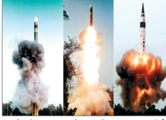
प्रयासों की सराहना करते हुए उन्हें शुभकामनाएं दी हैं। इस दौरान प्रमुख रक्षा अध्यक्ष जनरल अनिल चौहान, सामरिक बल कमांड के प्रमुख और डीआरडीओ तथा सेना के वरिष्ठ अधिकारी मौजूद रहे। मिसाइल के तीन

नई दिल्ली (एजेंसी)। सामरिक बल कमांड ने रक्षा अनुसंधान एवं विकास संगठन के साथ मिलकर बुधवार रात करीब सात बजे नई पीढ़ी की अग्नि प्राइम बैलेस्टिक मिसाइल का सफल परीक्षण किया है। रक्षा मंत्रालय ने एक बयान में बताया कि यह परीक्षण ओडिशा तट के डॉ. एपीजे अब्दुल कलाम द्वीप पर किया गया। परीक्षण के दौरान कई उपकरणों से इसकी निगरानी की गई। परीक्षण पूरी तरह सफल रहा और सभी मानकों पर खरा उतरा। टर्मिनल प्लाइट पर तैनात दो डाउनरेंज जहाजों समेत दूसरे स्थानों पर तैनात कई रेंज सेंसर से कैचर डेटा से भी इसकी पुष्टि हुई है। इस सफल परीक्षण पर रक्षा मंत्री राजनाथ सिंह ने पूरी टीम को बधाई दी है। डीआरडीओ के प्रमुख डॉ.समीर वी कामथ ने टीम के सहयोगियों और वैज्ञानिकों के