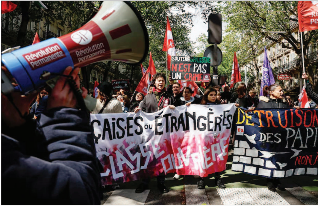
पेरिस में लोग नस्लवादी हिंसा के विरोध और बच्चों की सुरक्षा को लेकर एक प्रदर्शन में शामिल हुए।