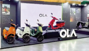
आईपीओ के लिए बाजार निगमक से मंजूरी मिल गई। इस मंजूरी के साथ ही ओला इलेक्ट्रिक को सूचीबद्ध होने वाली पहली भारतीय इलेक्ट्रिक वाहन कंपनी बनने की राह आसान हो गई है।

रखा है। सूत्रों के मुताबिक सीएचबीके समर्थित डीपी निमाता आईपीओ से करीब 4.5 अरब डॉलर का मुल्यांकन की संभावना है जो इसके पिछले फॉंडिंग राउंड के लगभग 5.5 अरब डॉलर के मुल्यांकन से लगभग 18 प्रतिशत कम है।