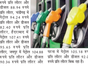
पटना में पेट्रोल 105.18 रुपये प्रति लीटर और डीजल 92.04 रुपये प्रति लीटर बिक रहा है।

103.44 रुपये प्रति लीटर और डीजल की कीमत 89.97 रुपये प्रति लीटर, कोलकाता में पेट्रोल की कीमत 104.95 रुपये प्रति लीटर और डीजल 91.76 रुपये प्रति लीटर और चेन्नई में पेट्रोल की कीमत 100.75 रुपये प्रति लीटर और डीजल की कीमत 92.34 रुपये प्रति लीटर है।