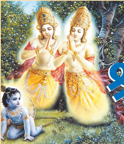
भगवान श्रीकृष्ण को सोलह कलाओं का अवतार माना जाता है। सच में कृष्ण ने समाज के छोटे से छोटे व्यक्ति का समाज बदलना, जो जिस भाव से सहजता की कामना लेकर कृष्ण के पास आया, उन्होंने उसी रूप में उसको इच्छा पूरी की। अपने कार्य से उन्होंने लोगों का इतना विश्वास जीत लिया कि आज भी लोग उन्हें 'भगवान श्रीकृष्ण' के रूप में ही मानते और पूजते हैं।