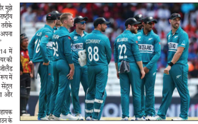
लियू कुल 229 मुकाबले खेले हैं। उन्होंने अंतरराष्ट्रीय क्रिकेट में छह शतक और 21 अर्धशतकों के साथ कुल 4688 रन बनाये हैं। वहीं न्यूजीलैंड में 252 विकेट पकड़े हैं।

वेलिंग्टन (एजेंसी)। भारत दौरे से पहले न्यूजीलैंड ने पूर्व ऑलराउंडर जेकब ओम को पुरुष टीम को निकायों को बनाया है वह सात अरबद्वार को अपना कार्यभार ग्रहण करेंगे। अपनी नियुक्ति पर ओपेन ने कहा, 'मैं ब्लैकक्रैस के साथ फिर से जुड़ने का अवसर पाकर वास्तव में उत्साहित हूँ।' उन्होंने कहा, 'एक ऐसी टीम के साथ फिर से जुड़ना जो मेरे लिए बहुत मयाने रहती है और मेरी जीवना का एक बड़ा हिस्सा रही है, वास्तव में सम्मान की बात है।' उन्होंने कहा, 'हाल ही में मुझे जो अवसर मिले हैं, उनसे मुझे इस बात का अंदाजा हुआ है कि यह टीम कब जा रही है और मैं अपने बाल सत्रों में उस पर काम जाऊँ। मैं अपने उत्साहित हूँ। ब्लैकक्रैस की गेटवाजी में